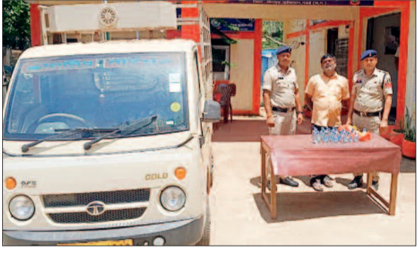
बड़ी कार्रवाई का इंतजार

प्राप्त जानकारी अनुसार पुलिस को बुधवार को मुखबिर से सूचना मिली कि एक छोटा हाथी वाहन क्रमांक सीजी 08 ए यू 4010 में अवैध रूप से शराब का परिवहन करते हुए पैलोमेटा से नर्मदा की ओर आ रहा है। सूचना पर थाना स्टाफ द्वारा शासकीय वाहन के साथ ग्राम मानपुर नाका के पास नाकाबंदी कर उक्त वाहन को रोका गया एवं तलाशी लिया गया। तलाशी के दौरान वाहन में लाल रंग के थैले में कुल 28 पौवा देशी प्लेन शराब, कुल मात्रा 5.04 बल्क लीटर मिला।