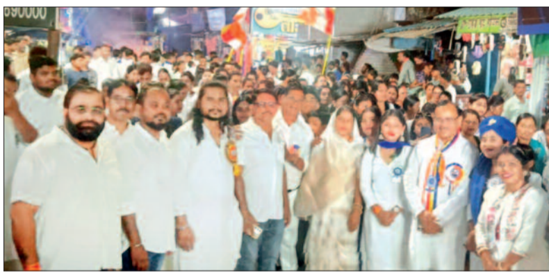
डोंगरगढ़

संविधान वेत्ता बाबा साहेब भीमराव अंबेडकर की जयंती पूरे क्षेत्र में धूमधाम से मनाई गई। जय भीम के नारों के साथ बौद्ध अनुयायियों ने बाबा साहेब के आदर्शों एवं उनके जीवन पर आधारित झोंकी का प्रदर्शन किया। पंथी नृत्य के साथ बाबा साहेब के गीतों पर नाचते झुमते लोगों ने शोभायात्रा निकाली। जयंती के मौके पर सुबह बौद्ध बिहार कालकापारा में तथागत भगवान बुद्ध और बाबा साहेब की प्रतिमा के सामने परित्राण पाठ कर नमन किया गया। जयंती के एक दिन पहले विशाल मोटर सायकल रैली का आयोजन किया गया। बाबा साहेब के जयकारों के साथ शहर का भ्रमण किया गया। स्थानीय तहसील कार्यालय स्थित बाबा साहेब की प्रतिमा के सामाजिक संगोष्ठी का आयोजन हुआ जिसमें राजनीतिक, सामाजिक लोगों ने हिस्सा