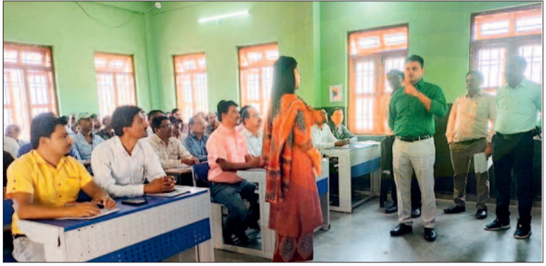
तीन बैच में होगा प्रशिक्षण

इस दौरान उन्होंने कहा कि जनगणना केवल आंकड़ों का संकलन नहीं है बल्कि यह शासन की विभिन्न विकास योजनाओं के प्रभावी क्रियायन का आधार है। उन्होंने सभी अधिकारियों एवं कर्मचारियों को पूरी जिम्मेदारी और सजगता के साथ कार्य करने कहा। प्रशिक्षण में शामिल प्रतिभागियों से संवाद करते हुए उन्होंने जनगणना की प्रक्रिया, प्रपत्रों के सही भराव, घर-घर जाकर जानकारी संकलन व डिजिटल एंट्री से संबंधित जानकारी ली। उन्होंने निर्देशित किया कि प्रशिक्षण के दौरान सभी तकनीकी पहलुओं को स्पष्ट रूप से समझाया जाए ताकि मैदानी स्तर पर किसी प्रकार की त्रुटि न हो।