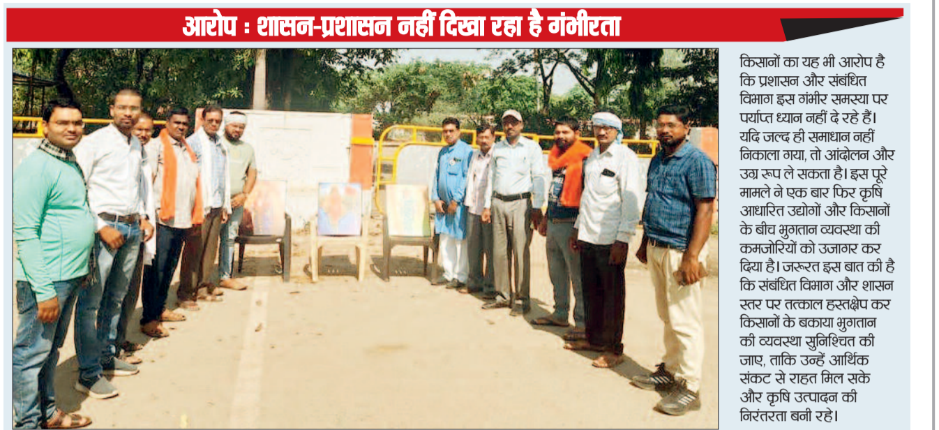
आरोप : शासन-प्रशासन नहीं दिखा रहा है गंभीरता किसानों का यह भी आरोप है कि प्रशासन और संबंधित विभाग इस गंभीर समस्या पर पर्याप्त ध्यान नहीं दे रहे हैं। यदि जल्द ही समाधान नहीं निकाला गया, तो आंदोलन और उग्र रूप ले सकता है। इस पूरे मामले ने एक बार फिर कृषि आधारित उद्योगों और किसानों के बीच भुगतान व्यवस्था की कमजोरियों को उजागर कर दिया है। जल्द ही बात की है कि संबंधित विभाग और शासन स्तर पर तत्काल हस्तक्षेप कर किसानों के बकाया भुगतान की व्यवस्था सुनिश्चित की जाए, ताकि उन्हें आर्थिक संकट से राहत मिल सके और कृषि उत्पादन की निरंतरता बनी रहे।